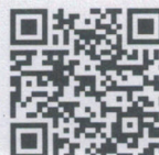
FLAVIO GOLIN Prefeito Municipal de Rio dos Índios