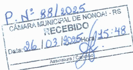
Ronivaldo Cassaro OAB/RS 123.079-A